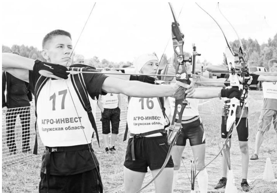
Дуэльная стрельба лучников.