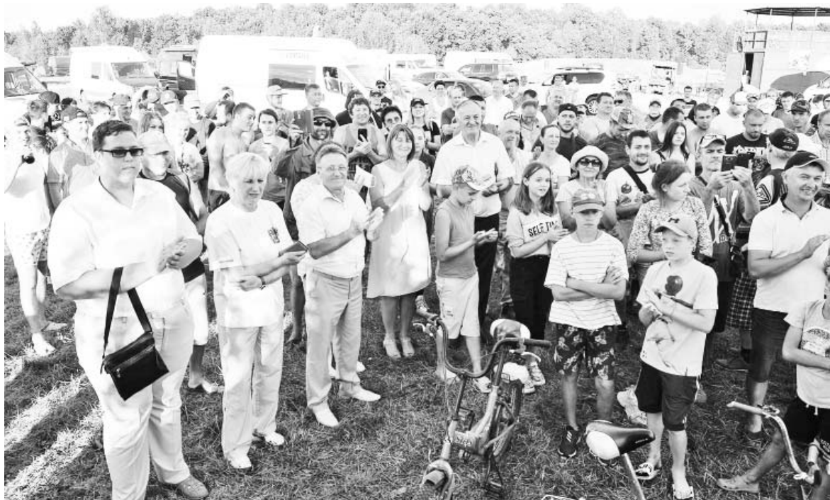
На церемонии награждения 9 августа.